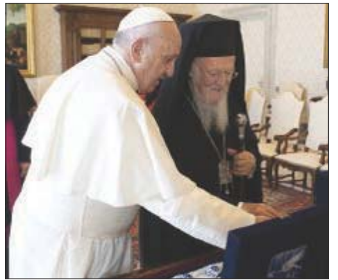
L'incontro di papa Francesco con Bartolomeo I